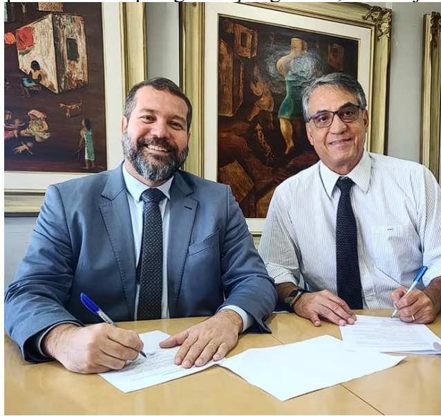
Figura 03: Momento da assinatura da OAB - Niterói / ESA Niterói e Universo da parceria para ministrar pós-graduação gratuita, com objetivo social