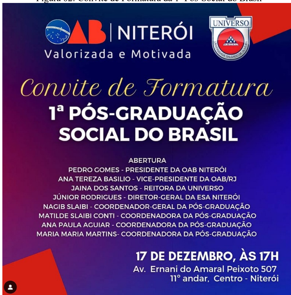
Figura 02: Convite de Formatura da 1ª Pós-Social do Brasil