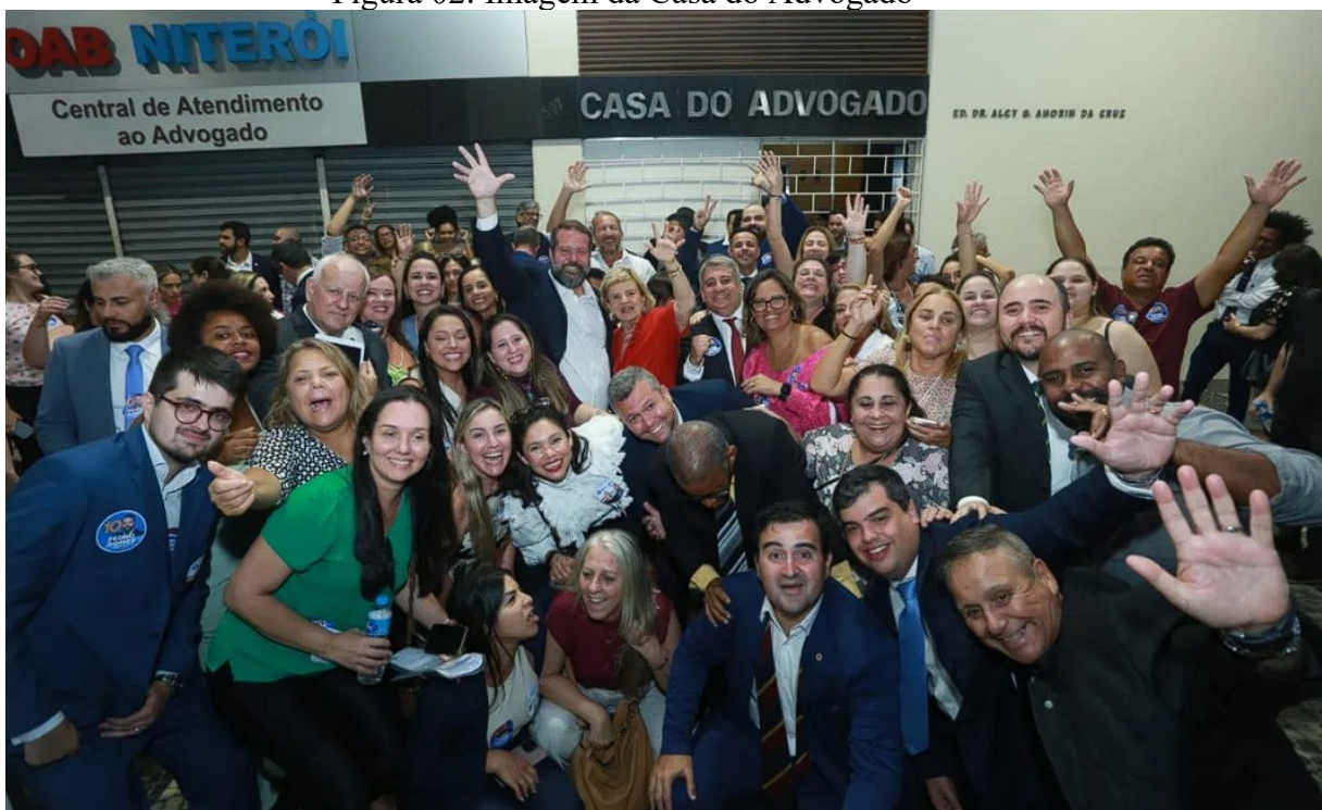
Figura 02: Imagem da Casa do Advogado