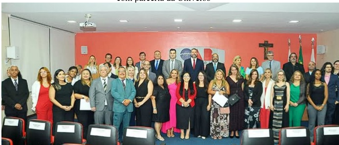
Figura 04: Formatura da primeira turma da Pós-Social da ESA Niterói & OAB Niterói com parceria da Universo