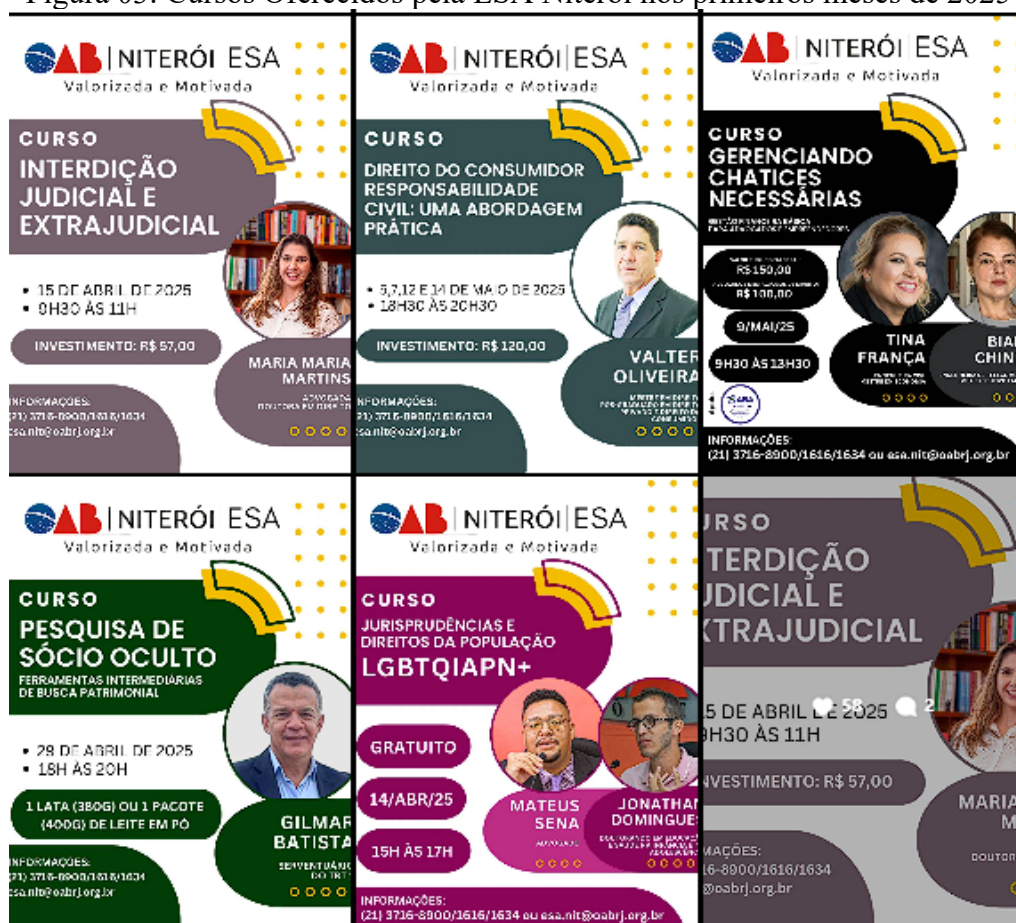
Figura 03: Cursos Oferecidos pela ESA Niterói nos primeiros meses de 2025